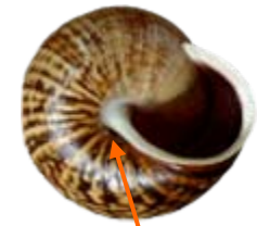
Bogail tebyg i hollt bach iawn

Yn well ganddo lleoliadau mwy gwlyb nag Cepaea ar gyfartaledd, ond yn aml yn byw yn yr un safleoedd. Mae'r cragen yn aml amrywio mewn lliw o brown tywyll i melyn, a gall fod band tywyll yn y canol neu beidio. Ceir bogail tebyg i hollt, a mae maint y min yn fwy crwn na'r Cepaea . Mae'r cragen fel arfer yn frith neu'n frychniog mewn Cepaea .